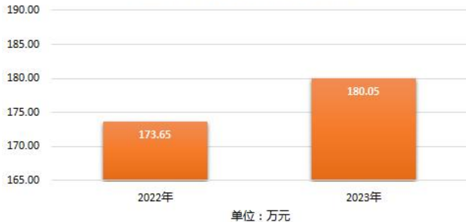
(图 1：收、支决算总计变动情况图)