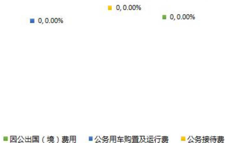
(图 7: “三公”经费财政拨款支出结构)

1. 因公出国(境)经费支出 0 万元, 完成预算 0%。全年安排因公出国(境)团组 0 次, 出国(境) 0 人。因公出国(境)支出决算与 2022 年度决算数持平。